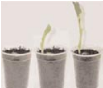
Figure 6. Observer le développement d'un plant de fève.

Remarque – Il peut être intéressant de comparer la taille des graines et de faire des prévisions à propos de la taille des plantes obtenues.