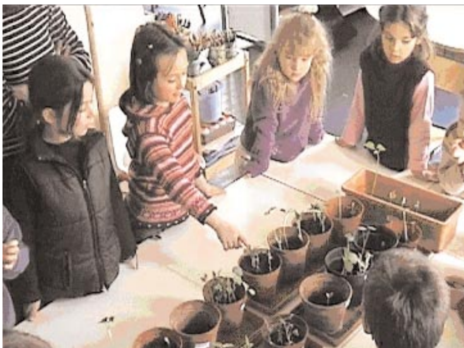
Figure 2. « Celle-là est moins grande... » Activité de comparaison entre espèces.

À l'école maternelle, le végétal est intéressant quand il déroule son cycle entier, mais également à travers des manifestations plus ponctuelles de sa vie. C'est le haricot semé qui permet la récolte de nouveaux haricots, pouvant donner eux-mêmes de nouvelles plantes : ces découvertes prendront une grande valeur pédagogique. Pour les élèves de l'école maternelle, planter en respectant le plus possible les conditions naturelles (terre, grands récipients, diversité des plantations) permettra de nombreuses observations. En complément de ce type d'activités sur le long terme, des temps plus courts, plus ciblés sur une action et le contrôle de ses effets sur la plante, pourront favoriser une investigation et inciter à une mise à l'épreuve des idées.