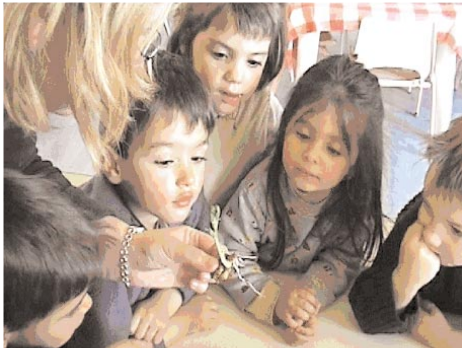
Figure 1. « On dirait des cornes, des branches, de la serpillière... » (à propos des racines).

Mettre en place des cultures en classe et/ou dans le jardin de l'école est une activité très motivante pour les élèves. À l'origine, ce peut être un projet de décoration de la cour de l'école, d'aménagement du coin potager ou la création d'un jardin à thème (jardin d'odeurs ou de couleurs...). Si la place dans la cour de l'école ne le permet pas, l'aménagement d'un espace « semis et plantations » dans la classe peut permettre de nombreuses activités et apporter bien des satisfactions.