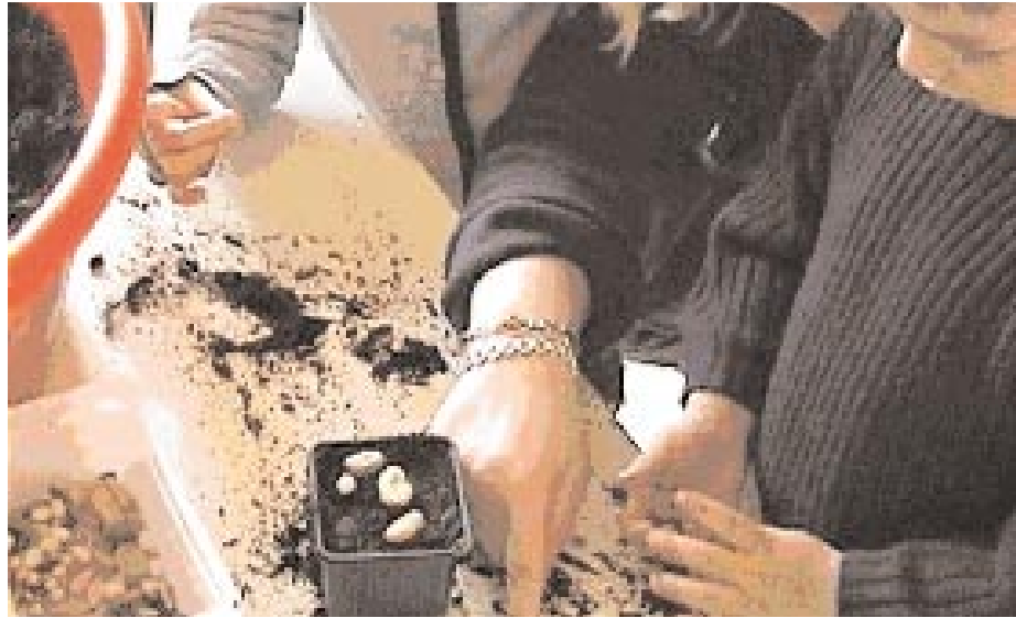
Figure 4. « J'ai mis toutes les mêmes... »

Montrer qu'une même sorte de graine donne une même espèce de plante.