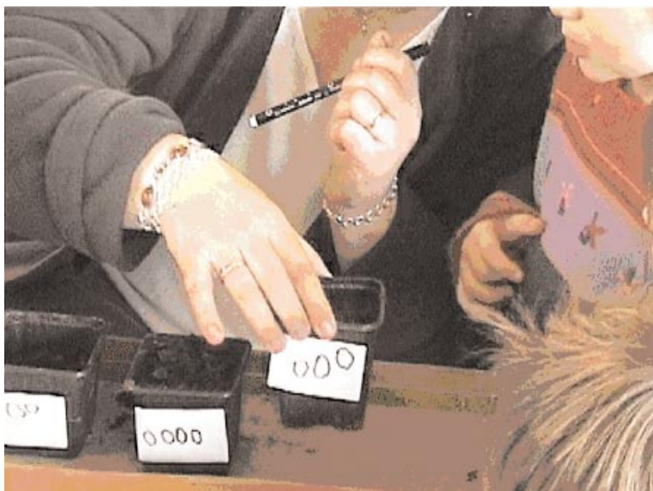
Figure 5. « Combien en as-tu dessiné ? » Correspondance une graine, une plante.

En petite et moyenne sections, faire un semis représentant la suite numérique de 0 à 10. Les pots pourront être codés avec le nombre de gommettes correspondant et le nombre écrit. Utiliser des grosses graines : fèves, pois ou haricots.